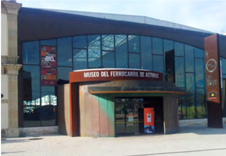
Museo del Ferrocarril de Asturias Pl. Est. el Norte, S/N