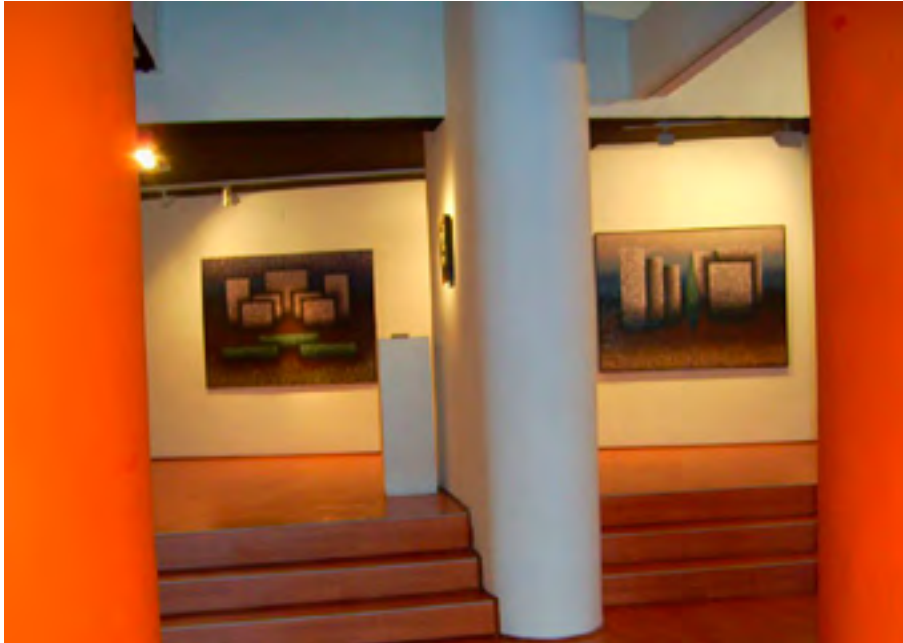
Espacio Astragal C/ Manuel Llana, 68