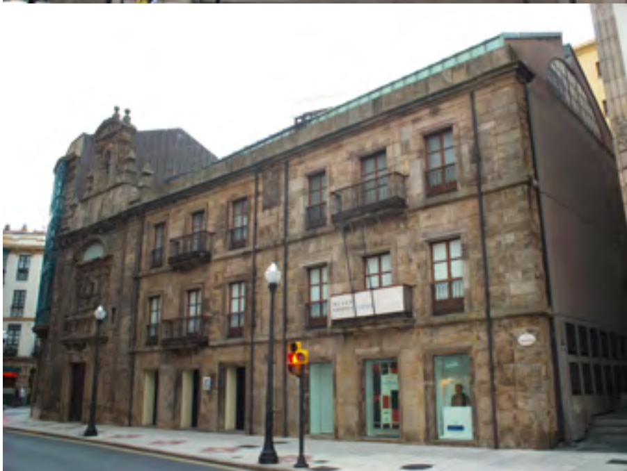
Museo Barjola Calle de la Trinidad, 17