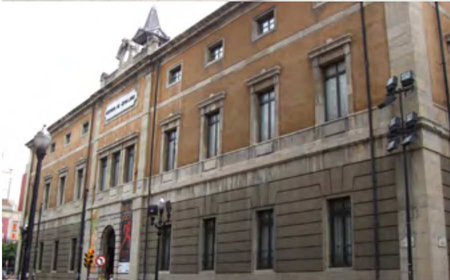
Centro de Cultura Antigo Instituto Calle Jovellanos, 21